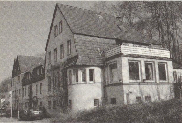
Das „Studentenheim“ in Bethel, Bethelweg 39, erbaut 1910. Zentrum der Theologischen Schule (Kirchlichen Hochschule) bis 1972; dann Seelsorgeinstitut. Das Gebäude wird inzwischen vom „Verein Hospiz Bethel e.V.“ und zu Wohnzwecken genutzt.