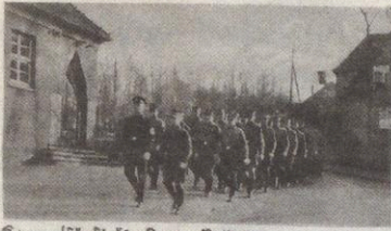
Kameradschaftshäuser in Bethel.