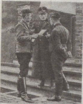
Eine Führerbekräftigung in der Theol. Schule in Bethel.

Die weitere Beschriftung ist ganz im Ton der damaligen Zeit gehalten: „Die Studentenschaft der Theologischen Schule zu Bethel ist eingegliedert in die ‚Deutsche Studentenschaft‘. Mit dem abgeschlossenen Semester ist damit ein Umbruch in dem Leben dieser wichtigen Ausbildungsstätte für Theologen der evangelischen Kirche erfolgt. Grundstein der studentischen Gemeinschaft ist der Wille zur Kameradschaft geworden. Bethel hat drei studentische Kameradschaftshäuser. Gerade die Gemeinschaft und ihre strenge Zucht schaffen dem Einzelnen auch die Freiheit zu ernster wissenschaftlicher Arbeit. Als Losung steht über dieser Arbeit: Deutscher Student sein im Dritten Reich und zugleich stehen in der Gemeinde Jesu Christi!“