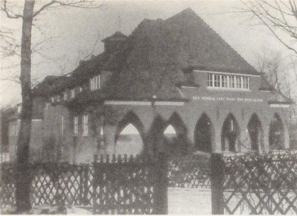
Der Remter der Theologischen Schule im Jahr 1927. (Nazareth-Archiv, N-F-0004).