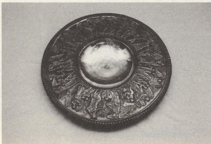
Immanuelkirche Preußisch Ströhen, Taufschale (Althöfer, 2007)