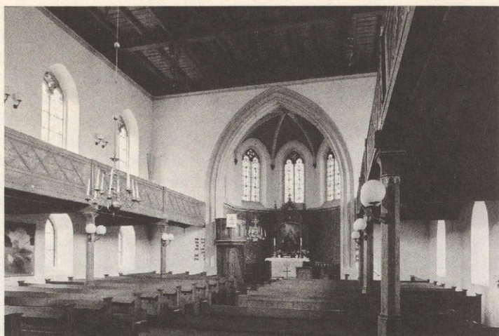
Immanuelkirche Preußisch Ströhen, Innenansicht (Althöfer, 2007)